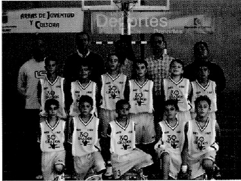
Equipo de la temporada 2006-2007